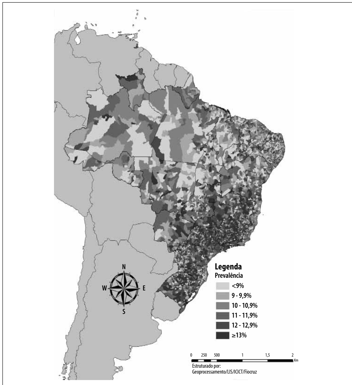
Figura 3 – Prevalência de nascimentos pré-termo por município. Brasil, 2011

possibilidades de sobrevivência de um recém-nascido pré-termo nessas regiões. Análises futuras do banco de dados corrigido do Sinasc deverão investigar as causas de tal paradoxo, inclusive a possibilidade de que o número excessivo de cesarianas e de induções ao parto esteja desempenhando um papel importante para os achados do estudo.