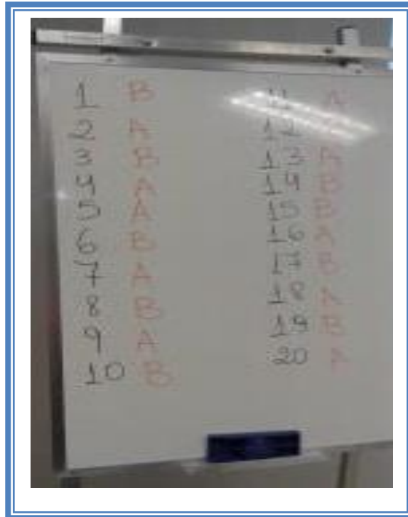
Figura 3: Foto do quadro no dia do sorteio (19/12/2018).